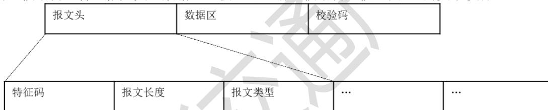
图 A.1 消息帧结构